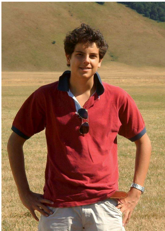
Seliger Carlo Acutis (1991-2006)