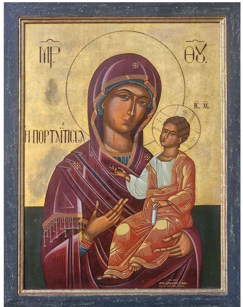
Muttergottes-Ikone vor dem Tabernakel in St. Michael in Dormagen